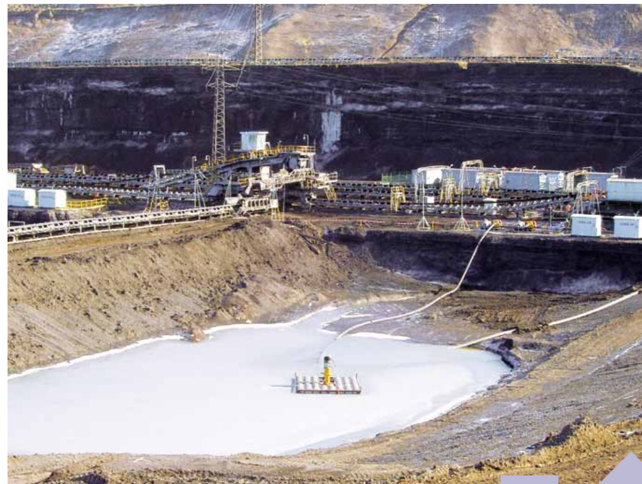
Použití rozvodů čerpacích stanic řady RČS pro přečerpávání dešťové vody v areálu Doly Nástup Tušimice.

Rozvodny jsou osazovány senzory pro spojitě měření hladiny kalu a vody ve sběrné nádrži, tlaku a průtoku v potrubí a měřeními elektrických veličin. Zpracování těchto hodnot provádí řídicí systém, který monitoruje chování celé stanice a ovládá veškeré její elektročásti na straně přívozu a jednotlivé vývody pohonů čerpadel. V normálních podmínkách jsou vývody řízeny automaticky dle měřených provozních parametrů čerpaného média. Pro přenos dat a řízení z dispečinku jsou automaty připojovány do metalické nebo rádiové komunikační sítě čerpacích stanic v dané lokalitě. Konstrukce rozvodů a materiály opláštění bývají používány stejně jako u transformačních stanic – ocel, pozink, Aluzink, tepelně izolační materiály. Rozměry jsou s ohledem na transport přizpůsobeny standardům v dopravě. V současné době se některé konstrukční