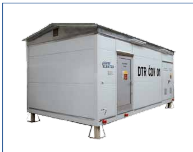
Příklady technologických rozvodů pro čerpací stanice RČS.

Pro napájení čerpadel velkých výkonů jsou používány modulární kompaktní rozvodny řady RČS s připojením k síti 22 kV nebo 35 kV pro napájení a ovládání čerpadel s motory o výkonu 1 až 3 × 500 kW a napětí 400, 500, 690 a 6000 V. Tyto rozvodny jsou osazeny transformátorem uvnitř stanice, VN přívozem a VN nebo NN vývody v souladu s požadovaným počtem a výkonem jednotlivých čerpadel. Pro účely snížení záběrných proudů motorů čerpadel nebo řízení průtoku mohou