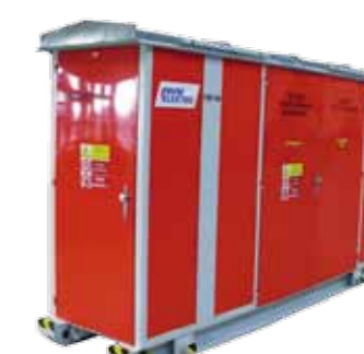
Příklady provedení transformačních stanic řady DT s transformátorem o výkonu do 1 MVA v přesuvném provedení.