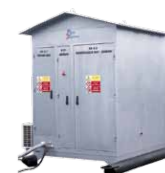
Příklady provedení kompenzačních kiosků a spínacího kiosku 6 kV.