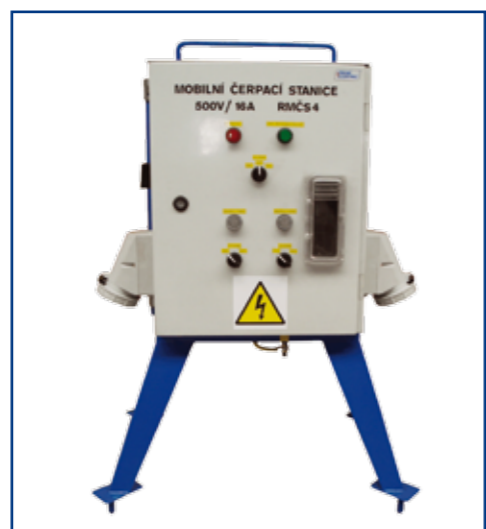
Příklady použití technologických rozváděčů čerpacích stanic RzČS - přesuvný a přenosný.